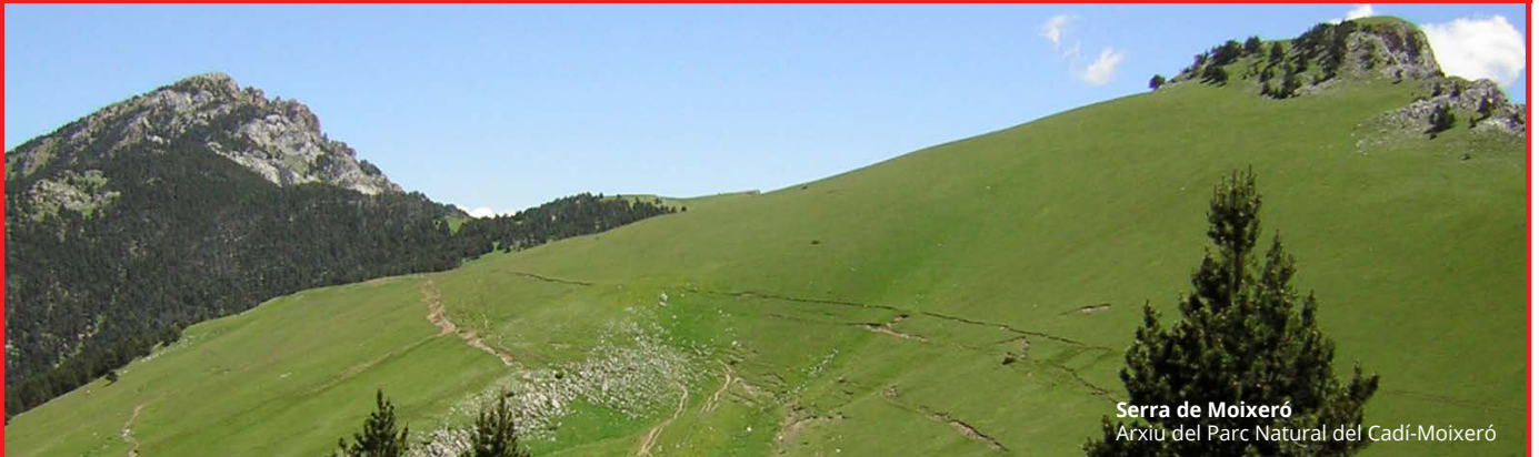
Serra de Moixeró