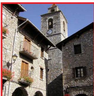
Bellver de Cerdanya Arxiu del P. N. del Cadí-Moixeró