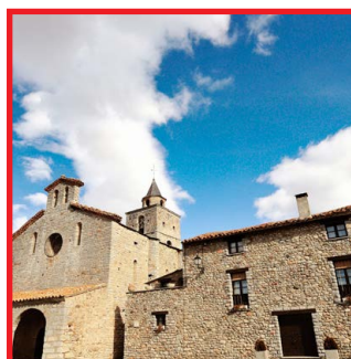
Santa Maria de Talló