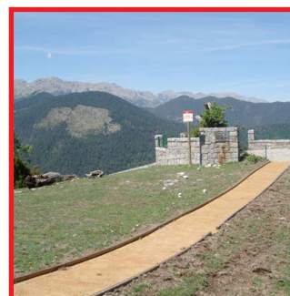
Mirador del Cap del Ras