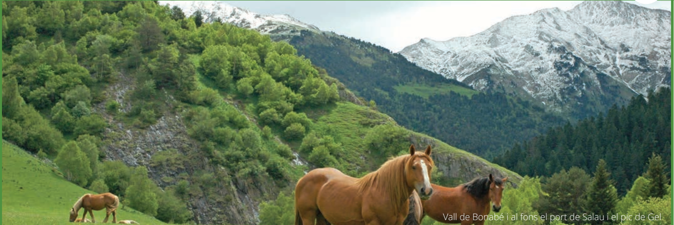
Vall de Bonabé i al fons el port de Salau i el pic de Gel