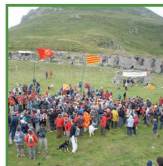
Aplec al Port de Salau