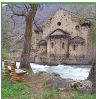
Sant Joan d'Isil