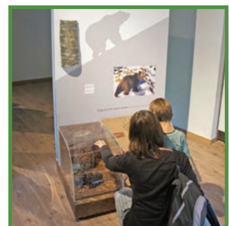
Casa de l' Os Bru dels Pirineus