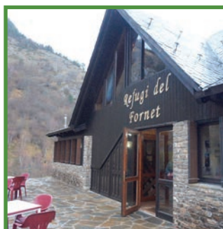
Refugi del Fornet